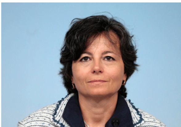
Maria Chiara Carrozza

Se la ricerca, come sostiene Maria Chiara Carrozza , è “pilastro della leadership industriale”, la parola “etica” resta comunque centrale quando si parla di intelligenza artificiale: etica del lavoro, ma sempre senza dimenticare uguaglianza e pari opportunità.